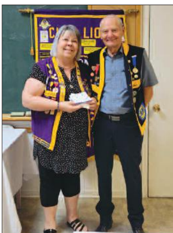
Médaille Lion Castor Lion Clément Lévesque