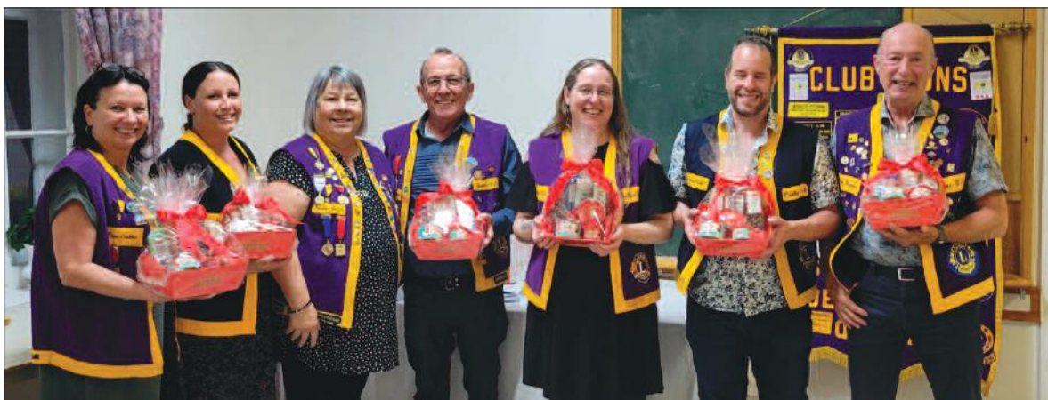
Remise de cadeaux aux membres du Conseil d'administration 2023-2024