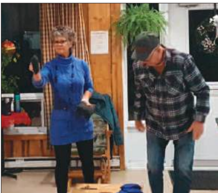
Soirée sociale du club Lions d'Amqui le 5 novembre dernier. Belle participation et beaucoup de plaisir !