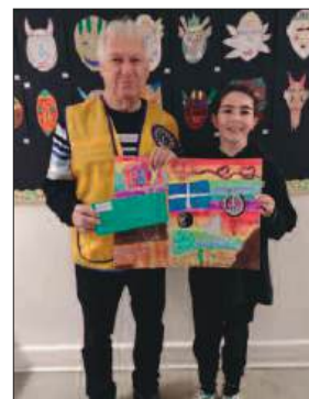
Première, deuxième et troisième positions.