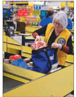
Financement annuel : emballage chez Maxi MERCI de votre contribution pour nos oeuvres et MERCI aux Lions bénévoles!