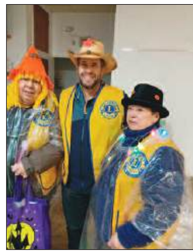
Lions Francine, Simon et Paulette