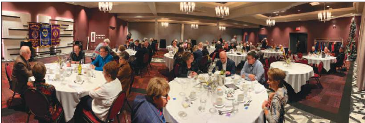
Présence des membres Lions lors de cette soirée