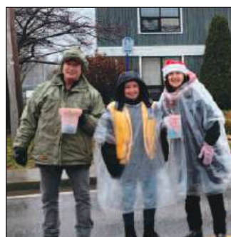
Il pleut il pleut