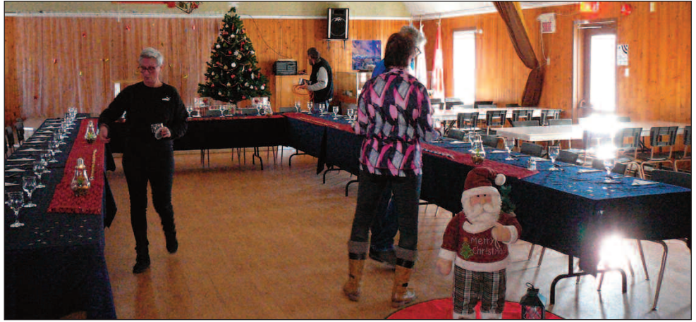
Montage de la salle pour le souper de Noël et préparation du repas