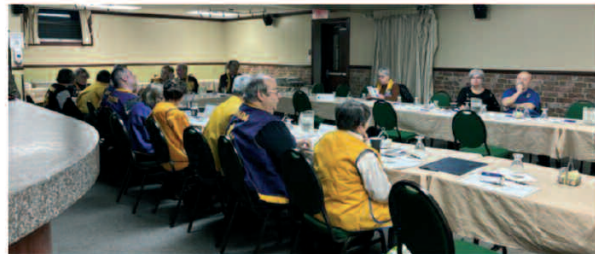
Membres Lions de la zone 42-Sud