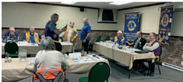
Membres Lions de la zone 42-Sud