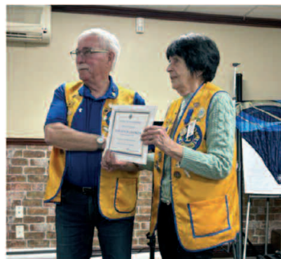
Remise du certificat de reconnaissance décerné au Club parrain Club Lions de Chandler Fondé le 20 janvier 1965 à l'occasion de leur 60 e anniversaire par le Club Lions de Paspébiac