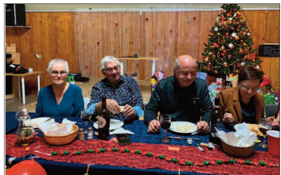
C'est la dégustation et les jeux imposés par notre comité soirée-loisir. Bonne année 2025 à vous tous et que tous vos souhaits se réalisent!