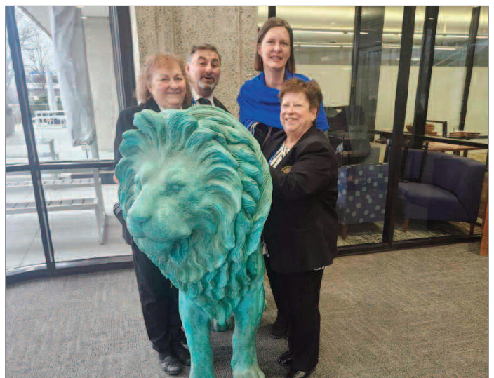
Lors de la visite au siège social, un beau gros Lion bien sage.