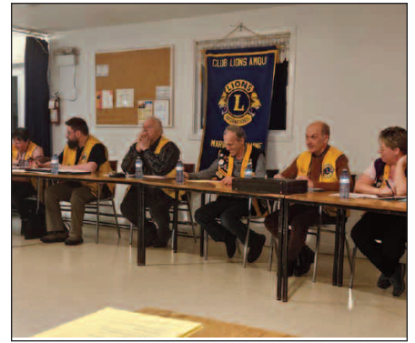
Le 26 février : réunion de zone avec les clubs : Amqui, St-Gabriel et Mont-Joli. Très belle participation.