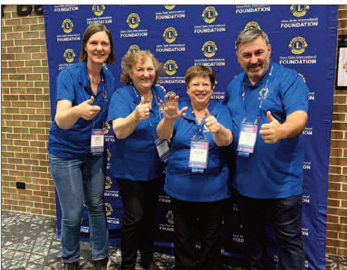
Les futurs gouverneurs qui appuient la mission 1.5 et la LCIF.