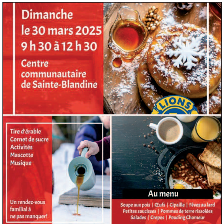
Dimanche le 30 mars aura lieu la première édition de notre Brunch de cabane à sucre! Nous avons très hâte de se sucrer le bec!