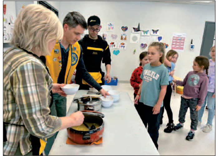
Ça bouge en mars pour le club Lions de Sainte-Blandine. 100 élèves de l'école des Merisiers ont pu avoir une super bonne soupe cuisinée et servie par les Lions. Une belle activité qui aide à contrer la malnutrition.