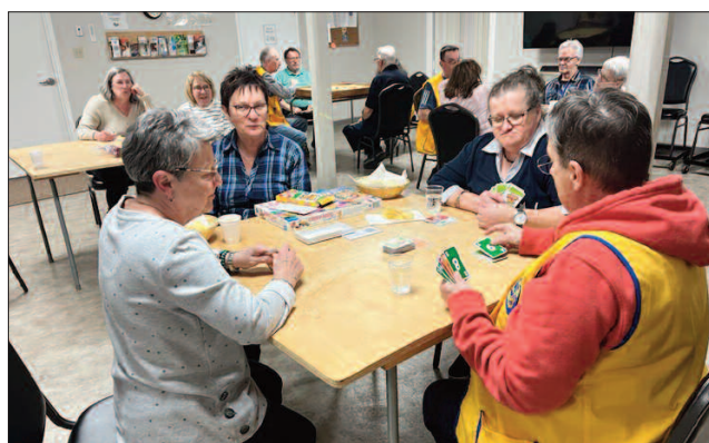
Une soirée bien agréable à faire des jeux.