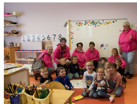
Photo de groupe des membres du Club Lions Avenir et des enfants de l'Ecole de Miquelon.