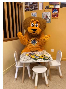
Léo la Mascotte du Club Lions Avenir aime aussi ce concept et colorie.