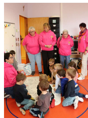
Découverte des « Drôles de Bouilles » par les enfants de l'Ecole Maternelle de Miquelon.