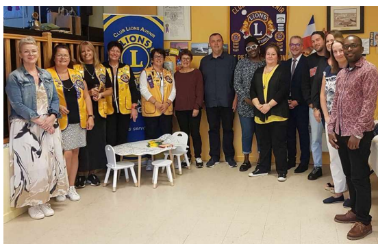
Les membres du Club Lions Avenir et les heureux récipiendaires de Saint-Pierre.